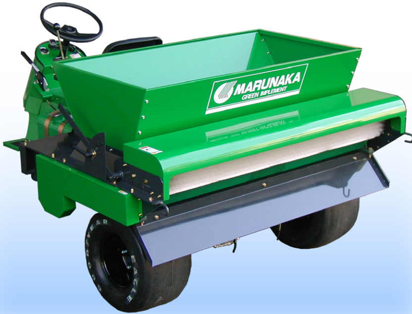
SDM300 + GJ18